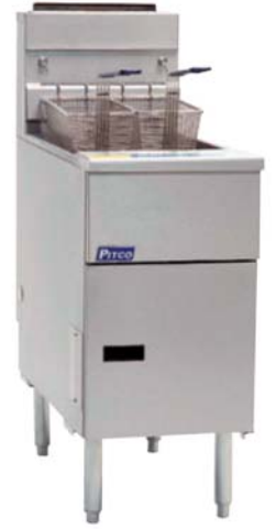
> SG 14 S