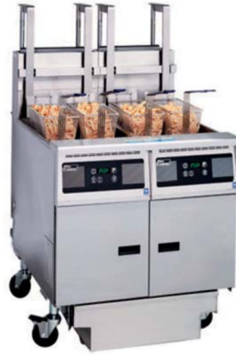
> SE 14 ikili